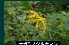
ナガミノツルケマン