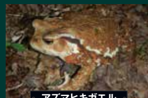
アズマヒキガエル