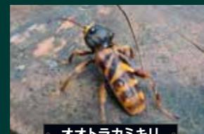
オオトラカミキリ